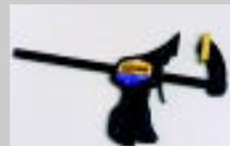
Attrezzo montaggio iniettori