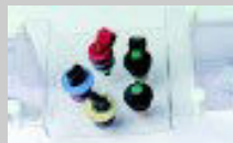
Culla iniettori ingresso dall'alto