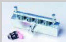
Navara blocco ingresso laterale