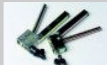
Attrezzi rimozione filtri e cappucci