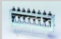
Supporto cremagliera flusso