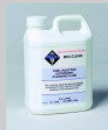
Bio Clean Vasca Ultrasuoni

ASNU è la soluzione completa per il processo di pulizia e prova degli iniettori le cui caratteristiche sono un programma completo di ricambi e accessori, e garantisce un continuo sviluppo di nuove attrezzature e adattatori.