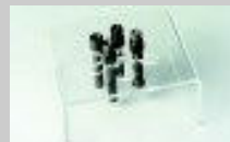
Culla iniettori K-jetronic